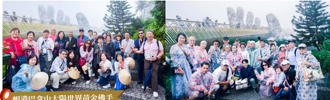
峴港巴拿山太陽世界黃金佛手