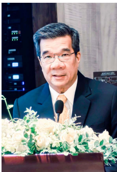
菲律賓馮永恩副主任僑情報告。