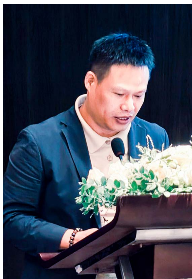
澳門尤裕質主任僑情報告。