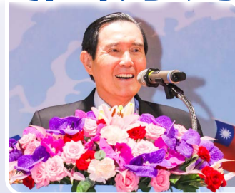
馬前總統感佩華僑對中華民國的貢獻深遠，並呼籲華僑節應世代延續，讓愛國精神不斷薪傳。