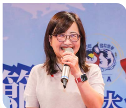
台北市副市長林奕華代表蔣萬安市長出席致詞表示努力打造台北成為僑胞溫暖的家。