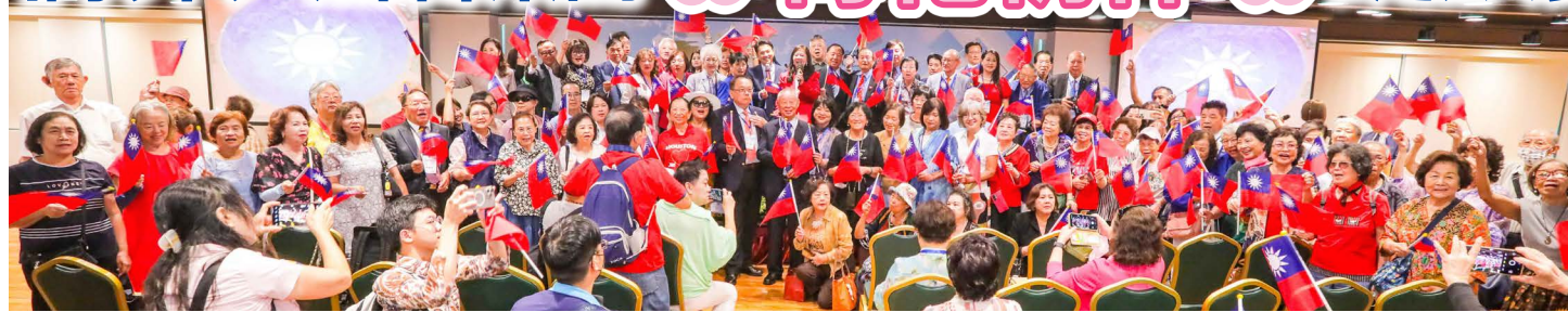
來賓揮舞國旗高唱愛國歌曲《國家》與《梅花》。