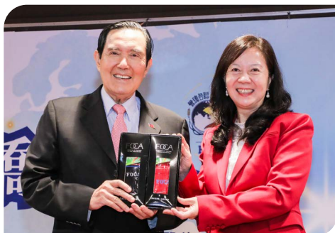
童惠珍理事長(右)致贈大會紀念品給馬英九前總統(左)。