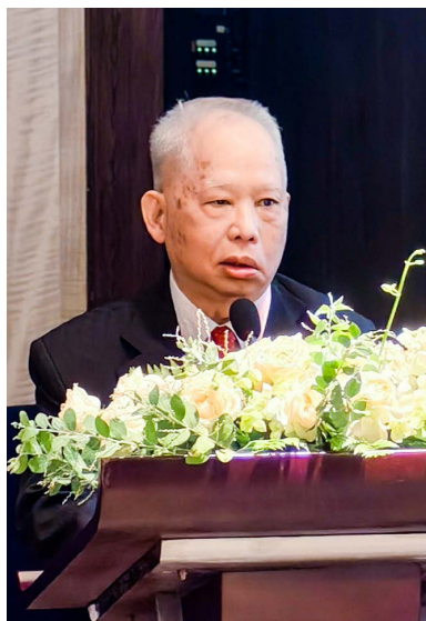
阿根廷簡四安主任僑情報告。