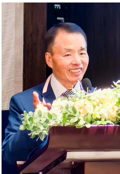
德國陳清峰常務理事僑情報告。