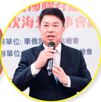
駐胡志明市台北經濟文化辦事處韓國耀處長致詞。