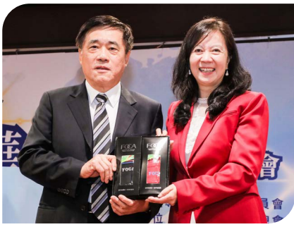
台北市前市長郝龍斌(左)與童惠珍理事長(右)合影。