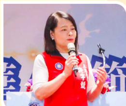
立委許宇甄感謝僑胞長期對中華民國的貢獻與熱愛。