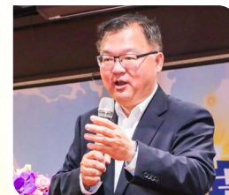
前立委李德維強調，有華僑才有中華民國與國民黨的創建。