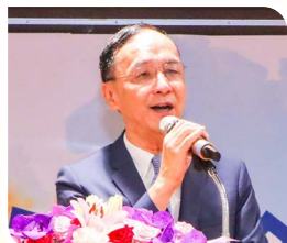
朱立倫主席感謝僑胞長年對國家與政黨的支持，強調國民黨將持續與僑界同行。