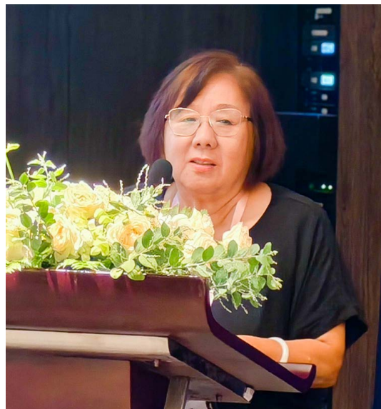
美國南加東曹靜永主任僑情報告。