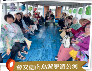
會安迦南島遊歷湄公河