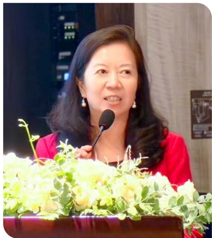
童理事長致詞，期勉全球僑胞攜手並進，凝聚僑心、發揮僑力，讓中華文化在世界各地綻放光芒。