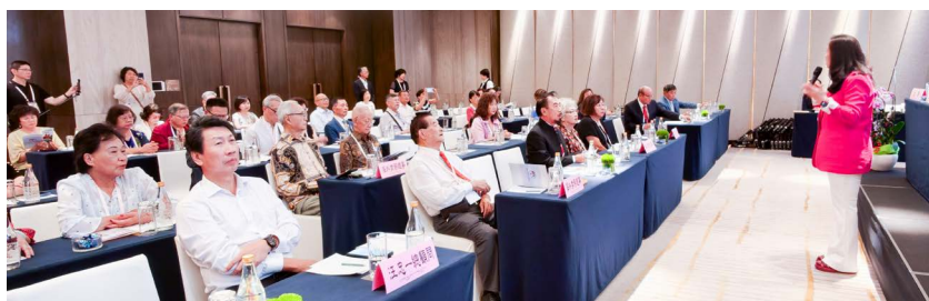
海外理事會進行，眾人聆聽童理事長報告會務。

童理事長在會務報告中指出，自接任以來深感責任重大，也感謝歷任理事長奠定的堅實基礎，讓僑聯總會的會務得以不斷創新與精進。她強調，僑聯自創會以來始終秉持「團結僑胞、愛國救國、弘揚中華文化」的宗旨，持續串聯海內外僑界，搭建合作與交流的平台，讓僑界在新時代持續發揮影響力。