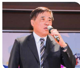
前北台市長郝龍斌承諾若當選黨主席，將強化海外與國際部門功能服務僑胞。