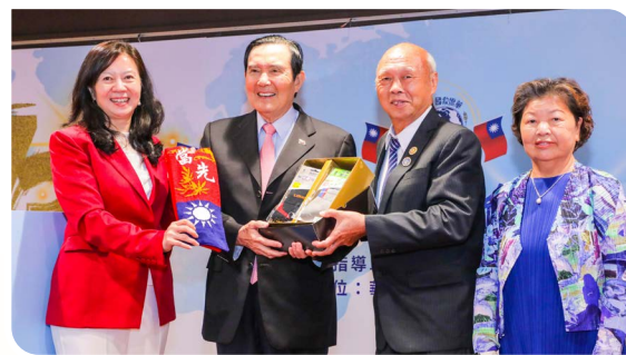
左起童惠珍理事長、馬前總統、劉信佑董事長伉儷。

慶典最後，全場嘉賓齊聚台前揮舞國旗，合唱《國家》與《梅花》兩首愛國歌曲，現場國旗飛揚、歌聲嘹亮，氣氛熱烈而感人，象徵全球華僑同心護國、傳承文化的堅定信念，為第73屆華僑節慶祝大會畫下完美句點。