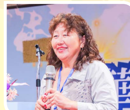
模里西斯明翠中常務理事致詞。