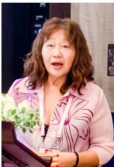
模里西斯明翠中常務理事僑情報告。

僑光社／越南胡志明隨著全球局勢變遷與國際互動日益頻繁，世界各地的僑界始終扮演著連結臺灣與國際的重要橋樑。華僑救國聯合總會第18屆第2次海外理事會期間，特別邀請來自十二個海外地區的主任及常務理事，包括南非、美國、澳門、菲律賓、印尼、香港、阿根廷、模里西斯、德國等地代表，共同就僑居地的社會現況、經貿發展與教育文化等議題進行僑情報告。 海外理事代表們分別從不同角度分享僑居地僑社動態與在地觀察，展現海外僑胞在面對多變的國際環境中，仍持續以行動支持臺灣、推廣中華文化的熱忱與韌性。無論是在推動經貿合作、深化僑教發展，或促進文化交流上，各地僑界皆展現出堅定的凝聚力與使命感，充分體現「僑心不分國界、情誼跨越海洋」的精神。