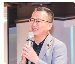
立法委員羅智強表示全球海內外僑胞都是家人，都是國家的堅實後盾。