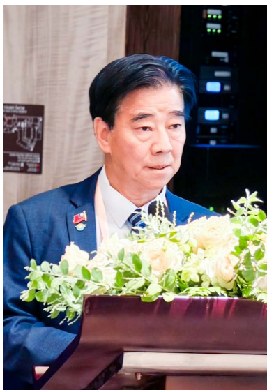
香港李嘉華社長僑情報告。