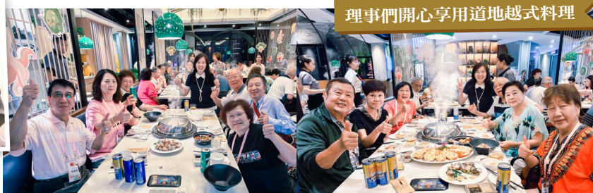
理事們開心享用道地越式料理